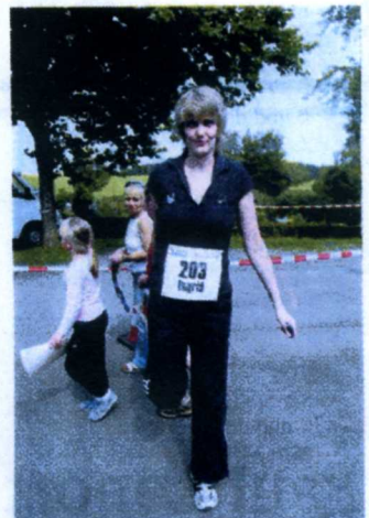
Noch optimistisch: Lauf-Greenhorn beim Dehnen.

Fazit, unmittelbar nach dem Einlauf: Diese Biesfelder sind verdammt hinterlistig. Ihre Dorf-Gewalttour „Jedermannlauf“ zu nennen, ist schon ein starkes Stück. Aber wir haben es geschafft! Keuchend sank ich auf einem Stuhl zusammen. Laut Zeitnahme war ich nicht einmal die Letzte: Platz 20 (von 22) bei den Frauen mit 35 Minuten und 57 Sekunden. Mein Freund hat